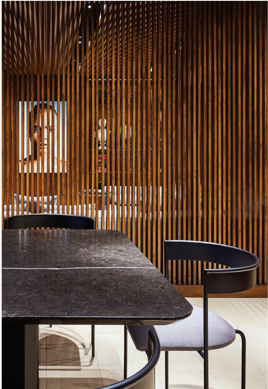
El mobiliario es una mezcla de diseño de Studio 91 —como la mesa de mármol del comedor— y distintas marcas como West Elm y Domus Design. “Quería que el espacio fuera un lugar fresco y lograr algo atemporal con el material principal que es la madera. Que fuera etéreo, que envolviera y ocultara al mismo tiempo las necesidades”, sostiene el arquitecto.