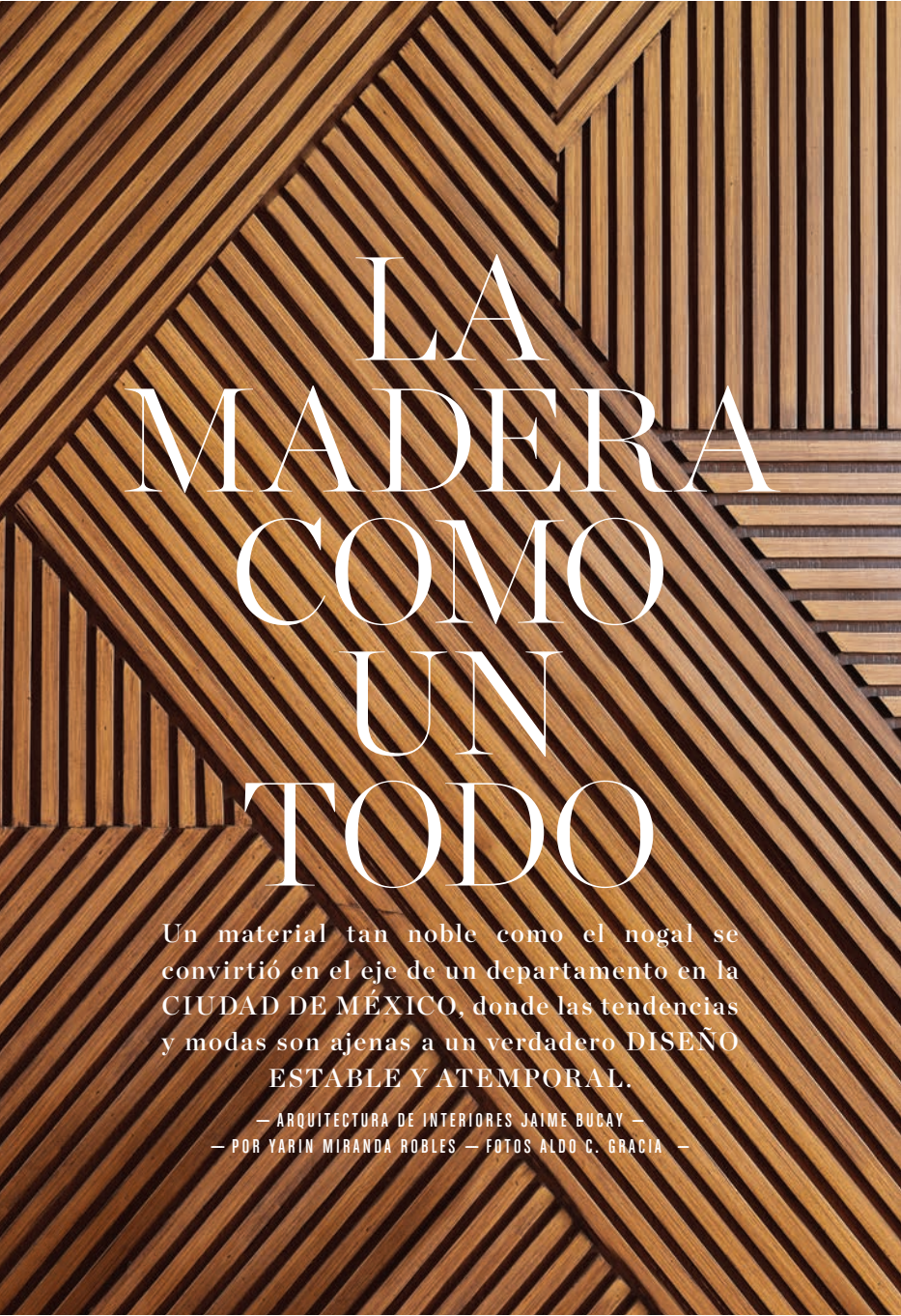
ARRIBA El trabajo artesanal que se realizó en este departamento conlleva una mano de obra altamente capacitada; hacer realidad el diseño del arquitecto Jaime Bucay sólo pudo lograrse con mano de obra de verdaderos ebanistas.