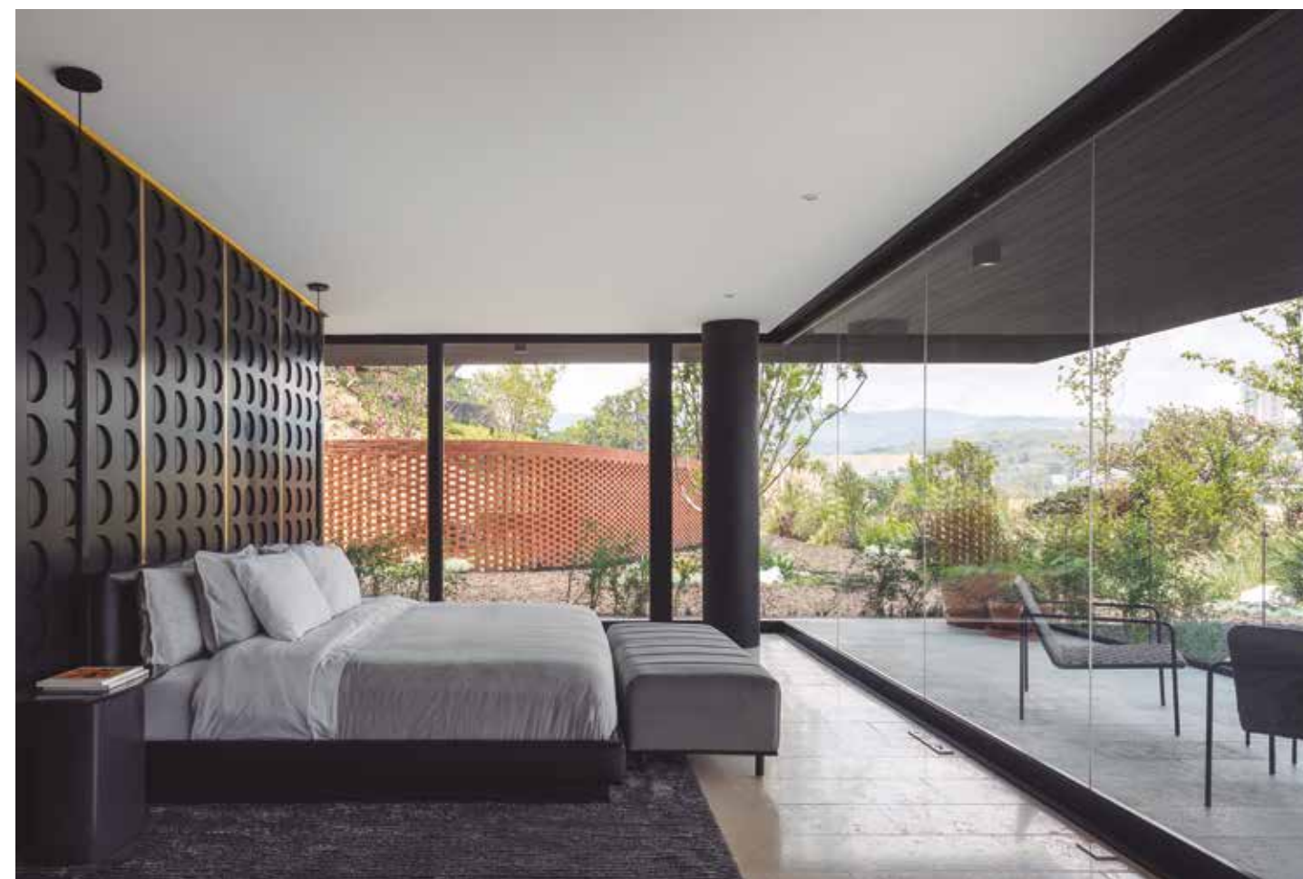
■ Casa Canto